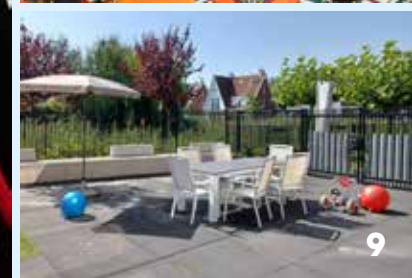
1. Pleegzorg Hackathon: nadenken over pleegouders werven; 2. Verbindingstuin geopend! Een moestuin met kas voor SDWerkt serviceteam Bovendonk om samen met de buurt te onderhouden; 3. Digihelden van SDW en SOVAK geslaagd; 4. Coming Out Week Roosendaal start bij SDW; 5. Esmée bij de Club van Roosendaal; 6. SDW en SOVAK werken samen; 7. SDW Mediateam op de première van hun campagnevideo over vooroordelen, in opdracht van de gemeente Roosendaal; 8. SDW krijgt NEN 7510 certificaat; 9. Bso 't Spilhonk geopend in Bergen op Zoom.