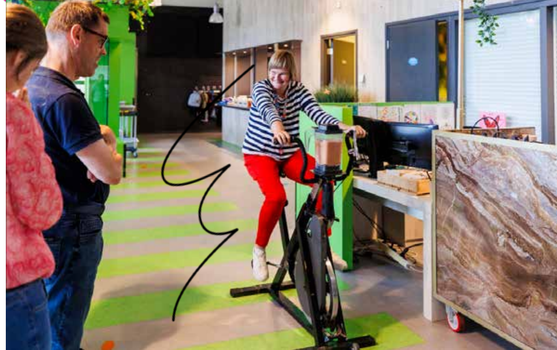
Fiets je eigen smoothie tijdens de Week van het Werkgeluk & Vitaliteit

Deze afspraken staan in onze plannen voor gebouwen. Zo kijken we bij beslissingen niet alleen naar wat nodig is en wat het kost. We kijken ook naar gezondheid, duurzaamheid en de kwaliteit van de omgeving.